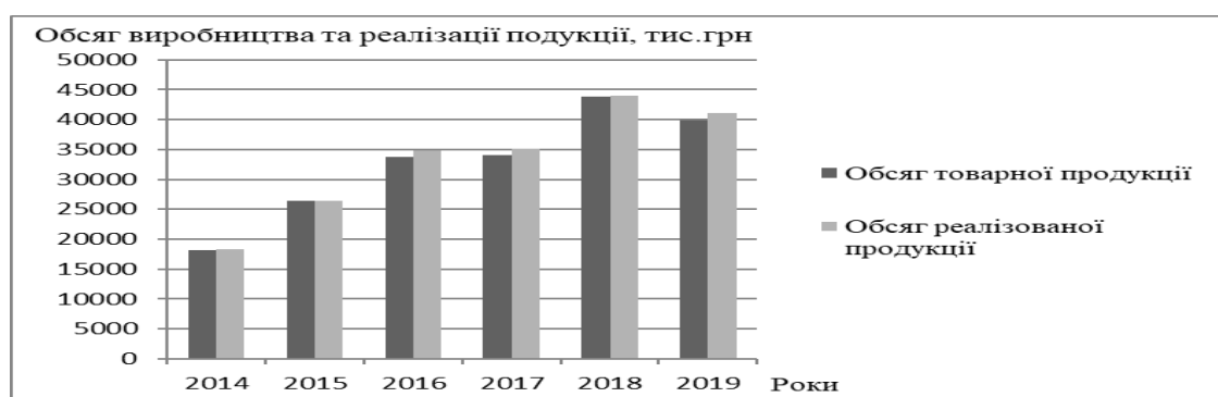
Рисунок 1. Динаміка обсягів товарної та реалізованої продукції швейної фабрики

За даними таблиці 1, у швейної фабрики результати виробничої діяльності дещо покращились протягом досліджуваного періоду. Зокрема, обсяги товарної і реалізованої продукції зростали на 119,73 % і 123,66 % відповідно. Діагностування показників виробничо-збутової діяльності щодо обсягів товарної та реалізованої продукції вказує на їх поступове зростання, що наочно простежується за допомогою рисунку 1.