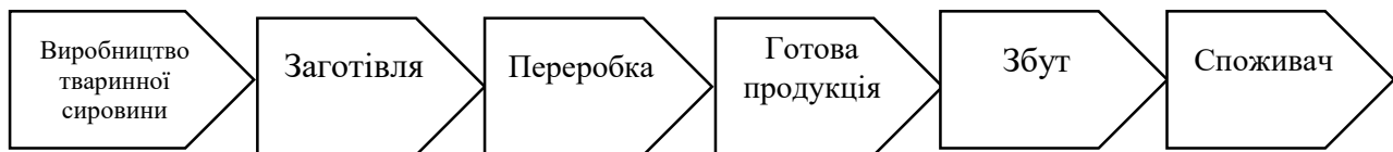
Рис. 4. Загальна схема формування ланцюга доданої вартості в тваринництві

Ланцюг доданої вартості в тваринництві охоплює всі етапи від вирощування тварин до споживання готової продукції, включаючи різноманітні процеси створення додаткової вартості на кожному етапі (рис. 4).