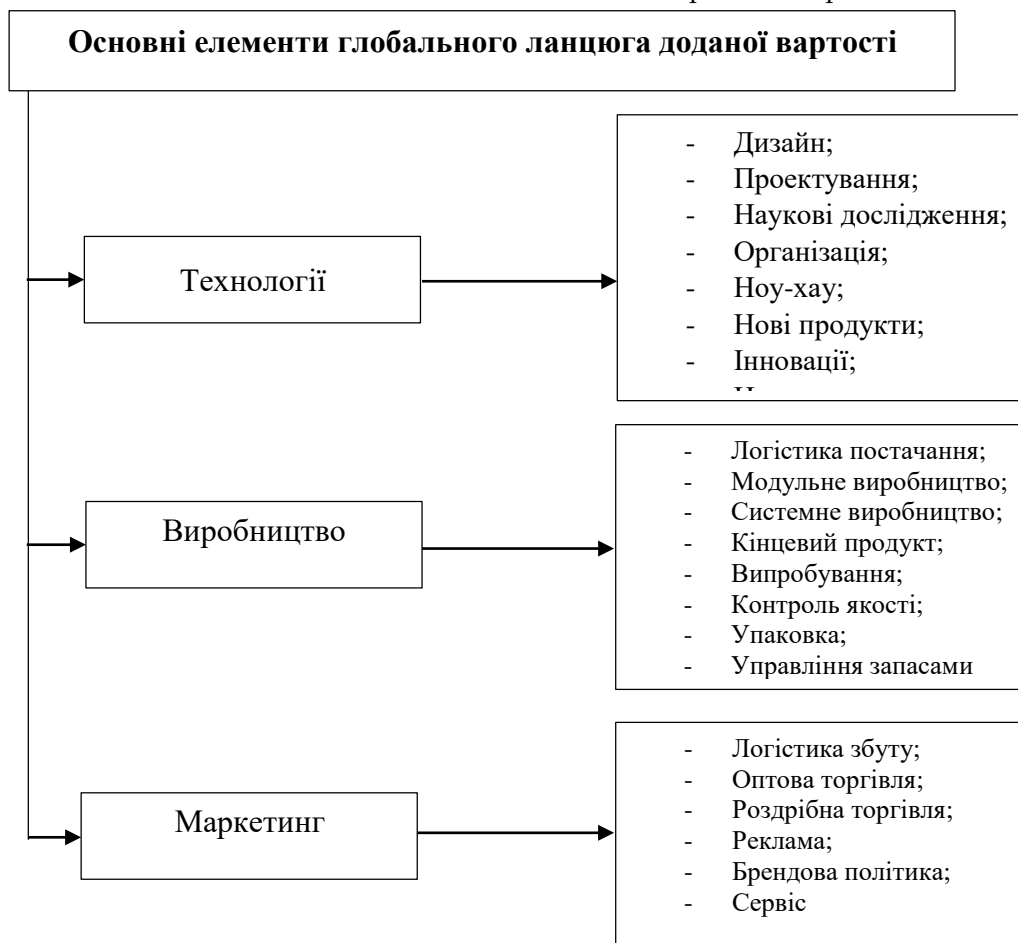
Рис. 3. Основні елементи глобального ланцюга доданої вартості

Ланцюг доданої вартості (нарощування вартості) є описовою моделлю, що використовується для висвітлення детальної послідовності оперативних і функціональних дій та застосовується для опису стадій виробництва товару. Такий ланцюг показує, що його ланки не перебувають у конкурентних відносинах, а тісно співпрацюють, спрямовані на досягнення спільної мети. Кожна ланка в цьому ланцюгу є підприємством, яке додає свою вартість до кінцевого продукту (послуги). Продукт (послуга) вважається завершеним лише тоді, коли він досягає фінальної стадії ланцюга. У зв'язку з цим, основні елементи глобального ланцюга доданої вартості товарів зазначено на рис. 3.