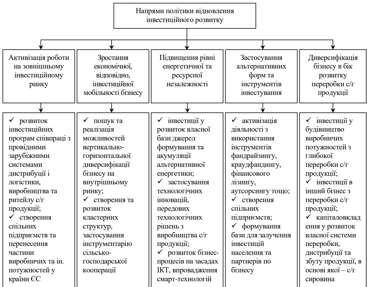
Рис. 2. Перспективи та засоби відновлення інвестиційного розвитку сільськогосподарських підприємств України в умовах фінансової нестабільності