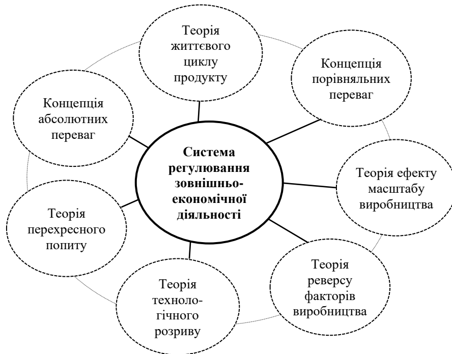
Рис. 1. Економічні теорії та концепції системи регулювання зовнішньоекономічної діяльності

експортну спеціалізацію. До прикладу, у промислово розвинутих країнах, де є відносний надлишок висококваліфікованої робочої сили та спеціалістів, експорт може відображати перевагу у виробництві високотехнологічної продукції, що вимагає високої кваліфікації працівників.