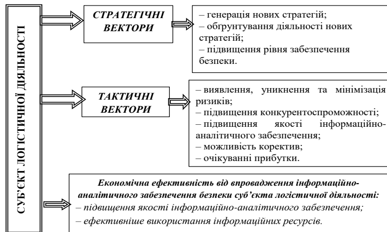
Рис. 2. Економічна ефективність від впровадження системи інформаційно-аналітичного забезпечення безпеки суб'єкта логістичної діяльності