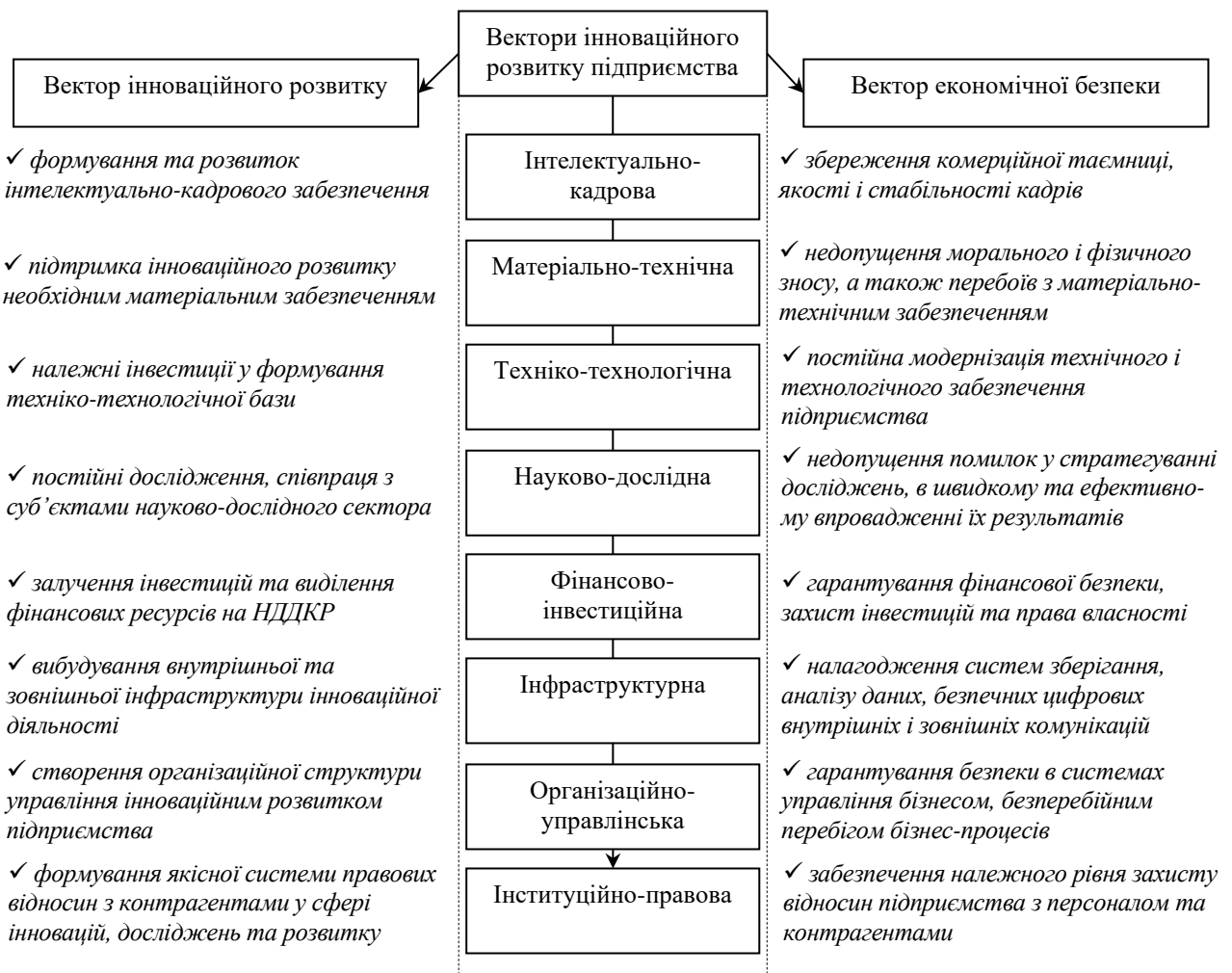
Рис. 1. Структурна декомпозиція інноваційного потенціалу та взаємообумовленість завдань інноваційного розвитку і економічної безпеки підприємства