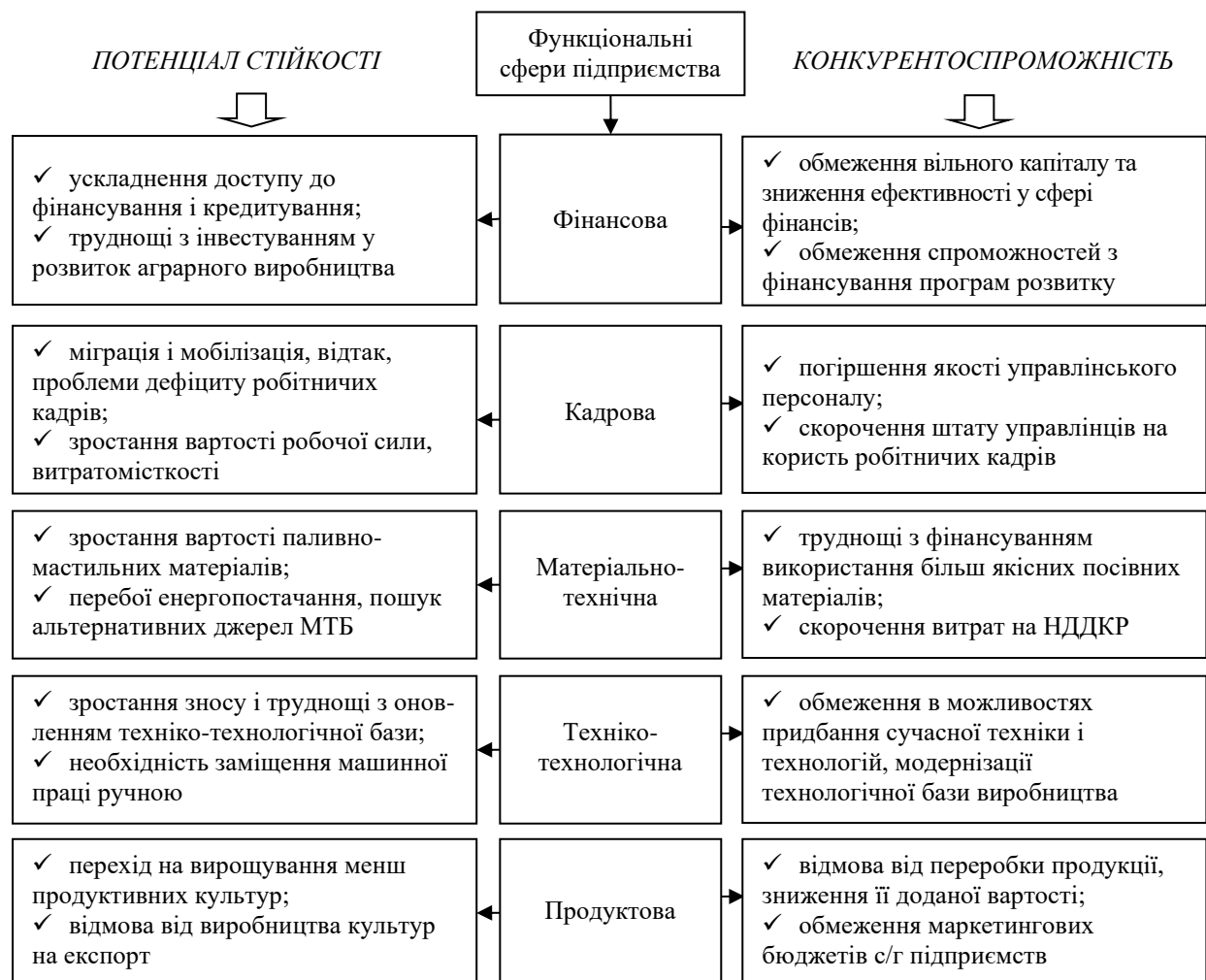
Рис. 1. Проблеми потенціалу стійкості та забезпечення конкурентоспроможності вітчизняних аграрних підприємств в умовах війни

На рис. 1 узагальнено проблеми потенціалу стійкості та забезпечення конкурентоспроможності вітчизняних аграрних підприємств в умовах війни.