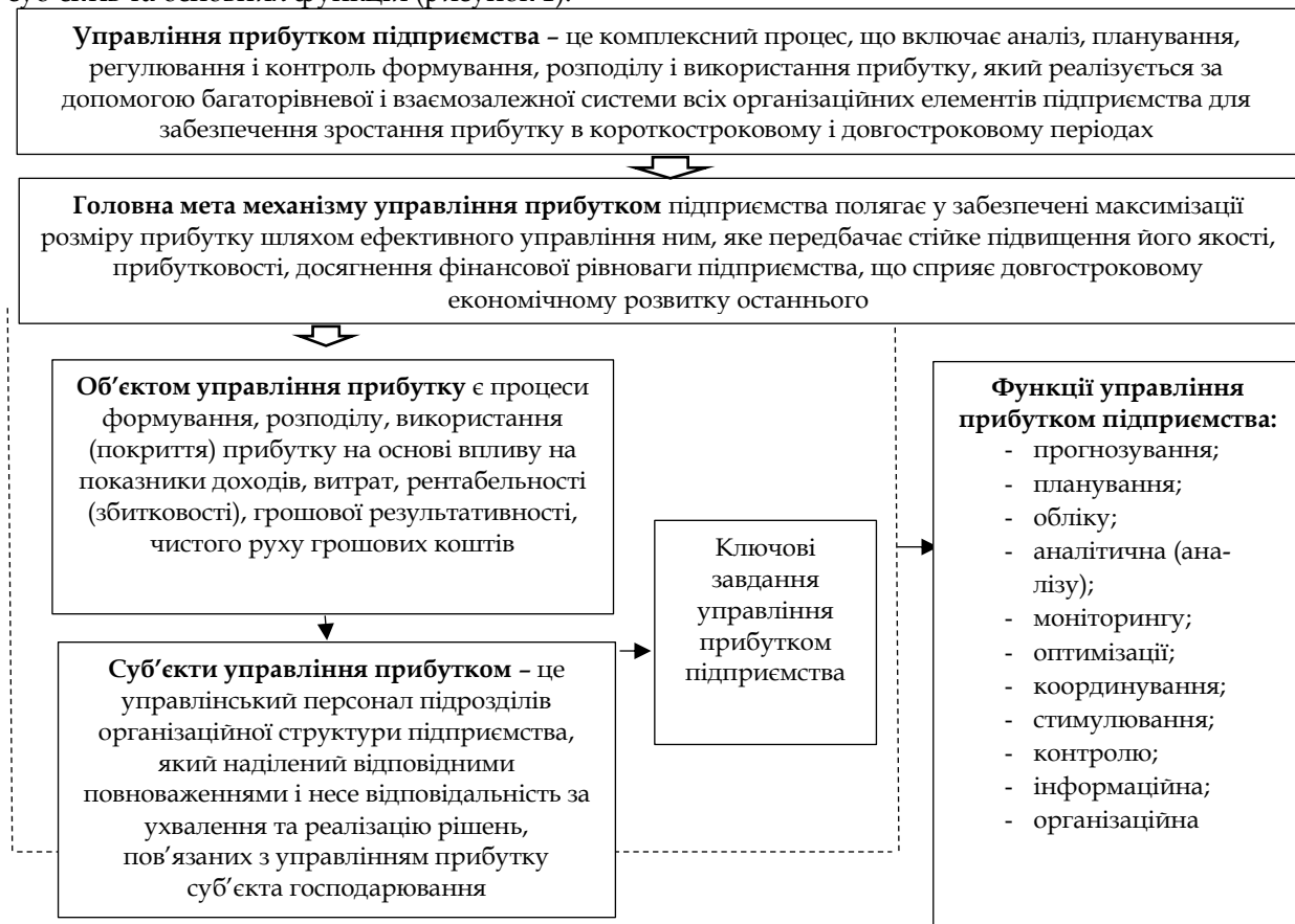
Рис. 1. Основних елементів механізму управління прибутком

Для забезпечення ефективного управління прибутком підприємства основною умовою є успішне досягнення головної мети та ключових завдань даного механізму. Реалізація зазначеної умови відбувається шляхом забезпечення взаємоузгодженої комплексної взаємодії основних елементів механізму управління прибутком, зокрема: головної мети, ключових завдань, об'єктів, суб'єктів та основних функцій (рисунок 1).