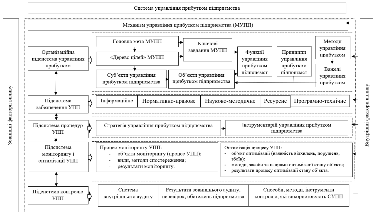
Рис. 3. Структура механізму управління прибутком підприємства

Здійснення суб'єктами управління прибутком підприємства процесів моніторингу і контролю функціонування даного механізму, сприяє успішному досягненню головної мети, вирішенню ключових завдань управління прибутком та підвищенню ефективної загальної системи менеджменту підприємства. Узгодженій взаємодії та ефективному функціонуванню усіх підсистем механізму управління прибутком сприяє наявність відповідних каналів зворотного зв'язку. Адже існування каналів зворотного зв'язку між підсистемами механізму управління прибутком спрямоване на забезпечення оптимізації, адаптованості функціонування даного механізму відповідно до умов зовнішнього та внутрішнього середовищ діяльності підприємства.