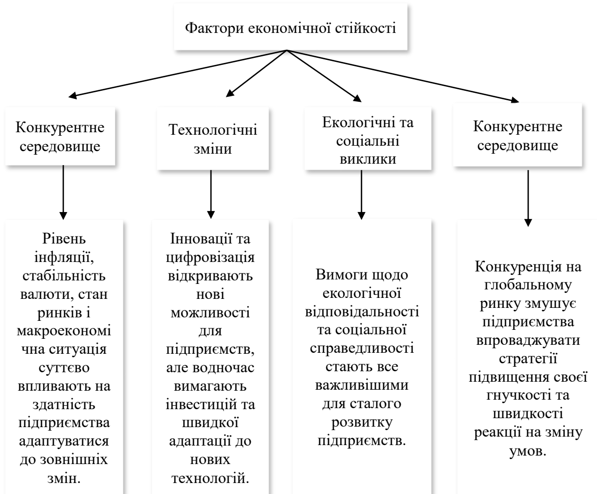
Рис. 1. Фактори економічної стійкості*

Таким чином, ці фактори взаємодіють між собою, визначаючи здатність підприємства адаптуватися та розвиватися в умовах сучасної економіки (рис.1)