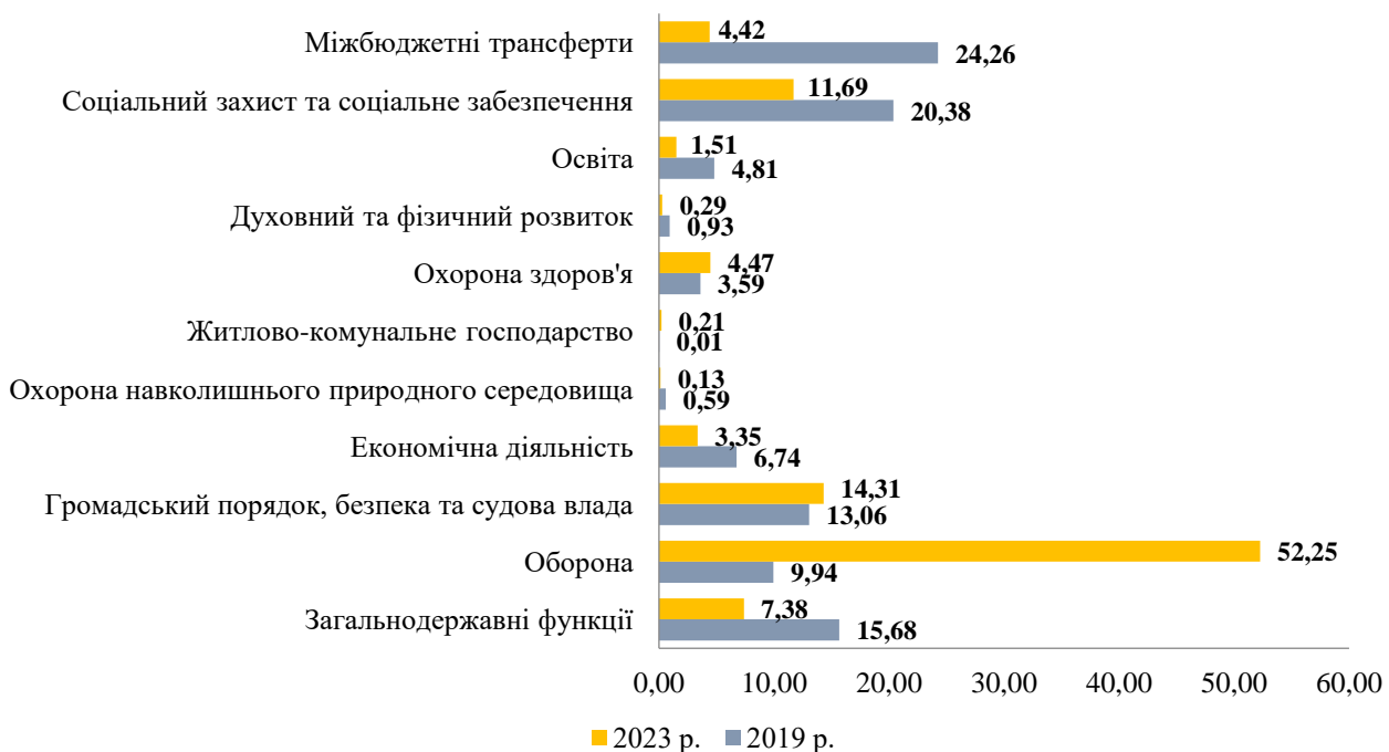
Рис. 2. Структура видатків Державного бюджету України за функціональною класифікацією за 2019, 2023 рр., %

Аналіз функціональної структури видатків показує, які сектори отримують найбільше бюджетне фінансування, що є важливим для розуміння пріоритетів уряду в кризовий період. Вивчення цієї структури допомагає також оцінити, наскільки ефективно держава підтримує сектори, що сприяють економічному відновленню. Структура видатків Державного бюджету за функціональною класифікацією наведена на рис.2.