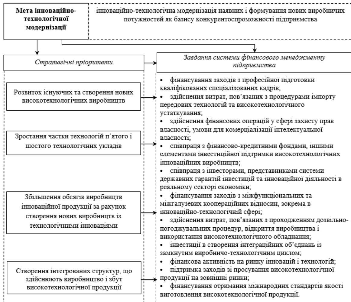
Рис. 1. Мета і стратегічні пріоритети інноваційно-технологічної модернізації та завдання фінансового менеджменту підприємства, які їм відповідають