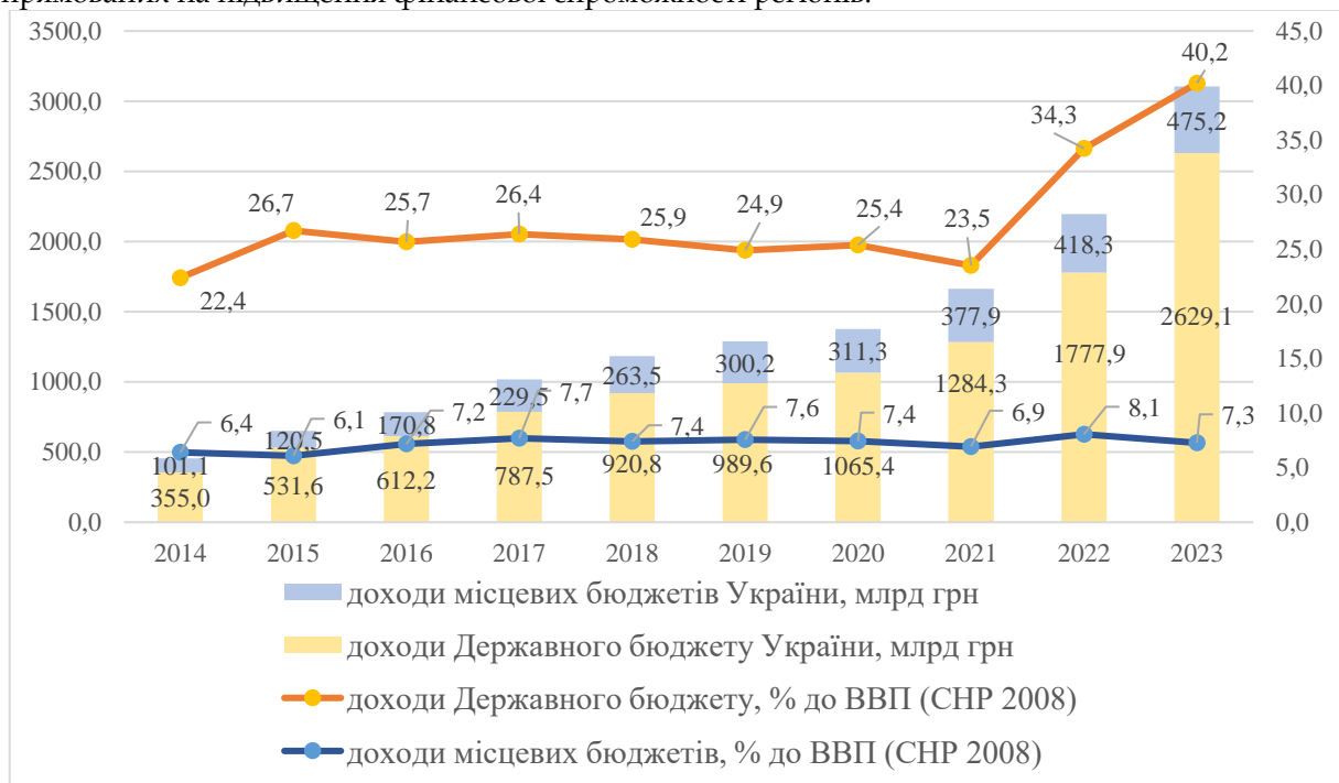
Рис. 1. Доходи Державного та місцевих бюджетів України (без врахування міжбюджетних трансфертів) у 2014-2023 рр.

Наведена динаміка зміни обсягів доходів зведеного бюджету України у 2014-2023 роках у розрізі державного та місцевих бюджетів свідчить про систематичний ріст цих показників (рис. 1). Однак, темпи зростання доходів державного бюджету перевищують темпи зростання доходів місцевих бюджетів, що свідчить про необхідність більшої концентрації уваги на заходах, спрямованих на підвищення фінансової спроможності регіонів.