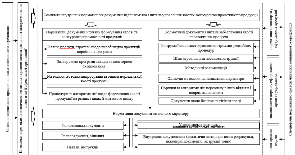
Рис. .2. Нормативно-методичне забезпечення механізму формування і підвищення якості та конкурентоспроможності продукції підприємства*