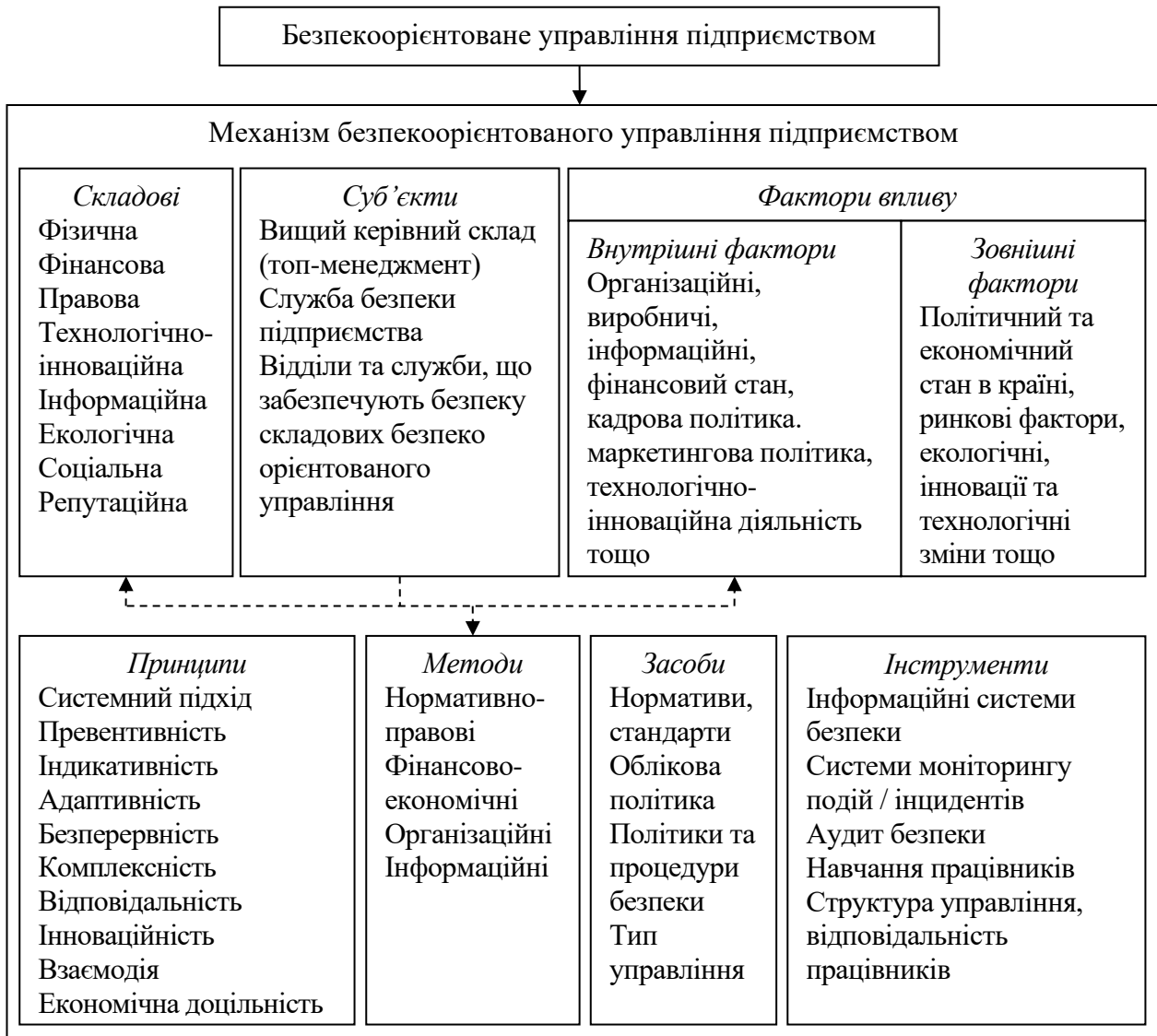
Рис. 4. Складові механізму безпекоорієнтованого управління підприємством

Складові механізму безпекоорієнтованого управління підприємством представлено на рис. 4.