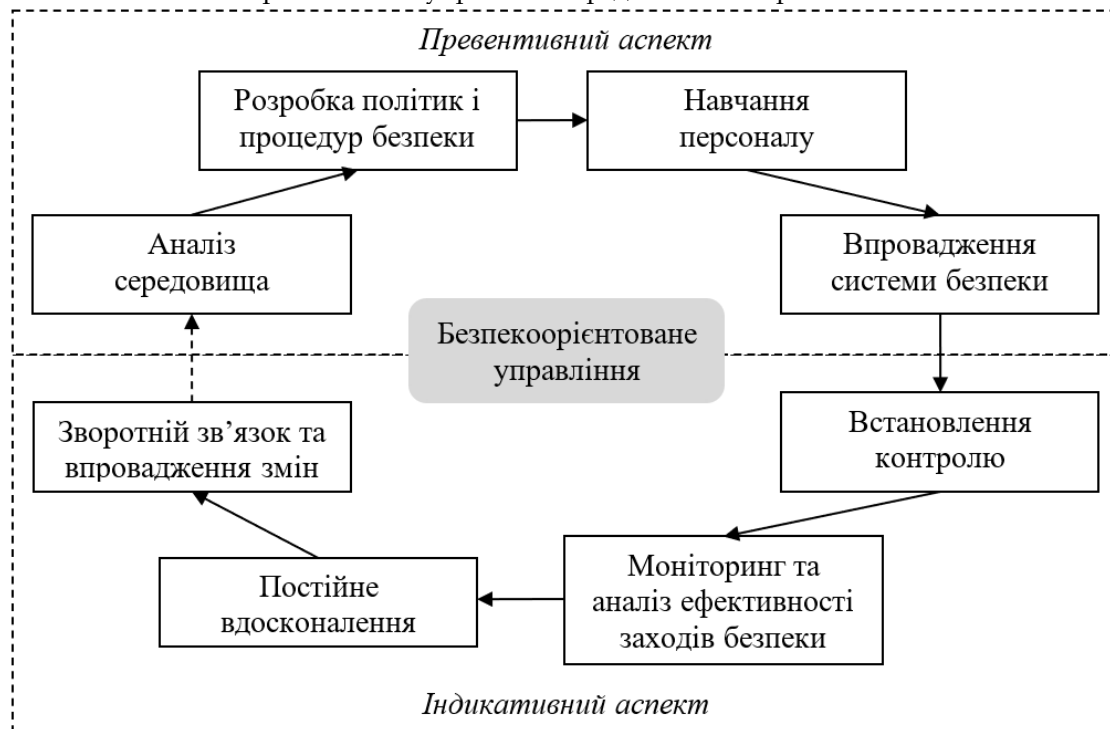
Рис. 3. Етапи безпекоорієнтованого управління на підприємстві

Безпекоорієнтоване управління є переважно превентивно-індикативним, оскільки спрямовано на запобігання загрозам і ризикам, а також на своєчасне виявлення і реагування на потенційні проблеми. Етапи безпекоорієнтованого управління представлено на рис. 3.