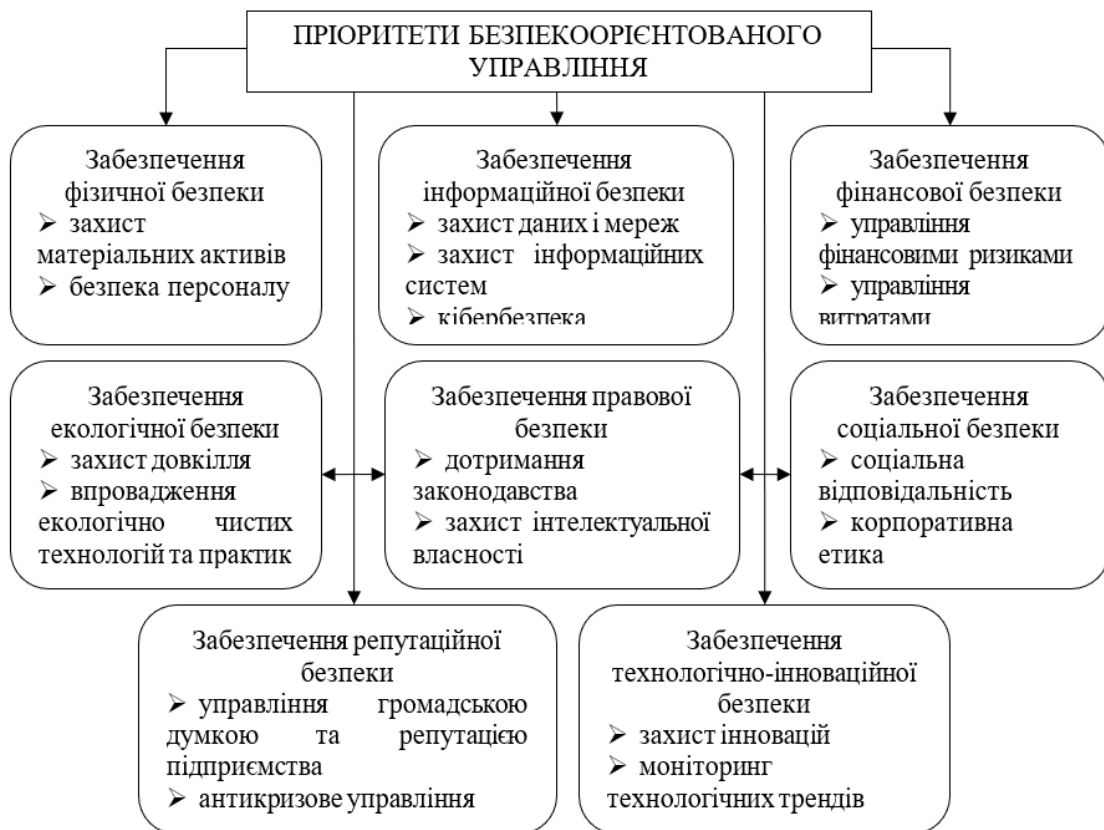
Рис. 2. Ключові пріоритети безпекоорієнтованого управління в діяльності підприємства

Безпекоорієнтоване управління є переважно превентивно-індикативним, оскільки спрямовано на запобігання загрозам і ризикам, а також на своєчасне виявлення і реагування на потенційні проблеми. Етапи безпекоорієнтованого управління представлено на рис. 3.