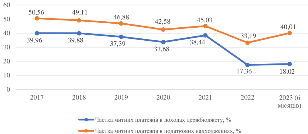
Рис. 1. Частка митних платежів у доходах державного бюджету та у податкових надходженнях, %.

Крім того, митна політика України передбачає і фіскальні інтереси – стягнення мит та митних платежів, та контроль за своєчасністю їх справляння (рис.1).