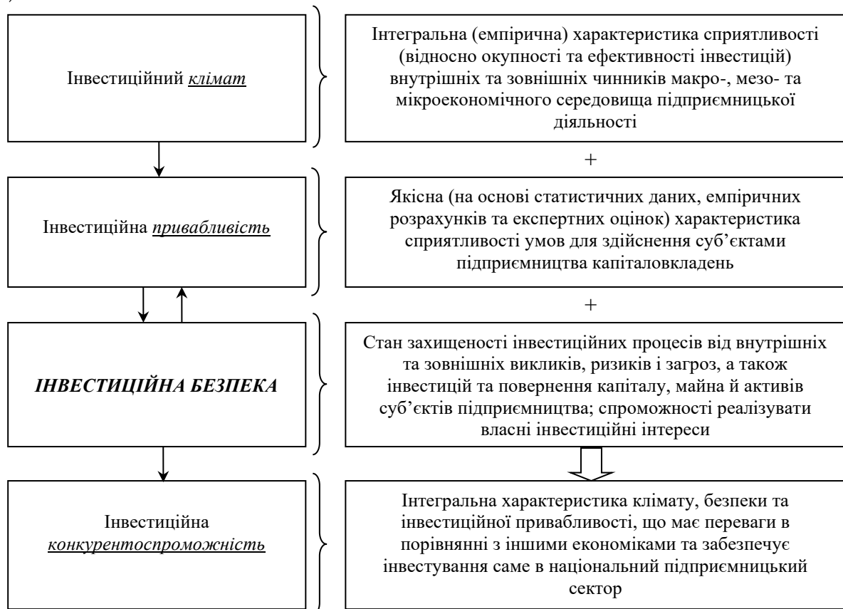
Рис. 1. Змістова характеристика поняття інвестиційної безпеки підприємницького сектора національної економіки та її місце з-поміж понять інвестиційного «клімату», «привабливості» та «конкурентоспроможності»

Інвестиційна безпека на рівні підприємницького сектора економіки на сьогодні досліджена ще у не достатній мірі. Оскільки це макро- та/чи мезоекономічна категорія, то суб'єктом забезпечення цієї складової економічної безпеки національного господарства є держава, а відповідне безпекове середовище утворюються в системі чинників з-поміж таких понять, як інвестиційний клімат, інвестиційна привабливість та інвестиційна конкурентоспроможність (рис. 1).