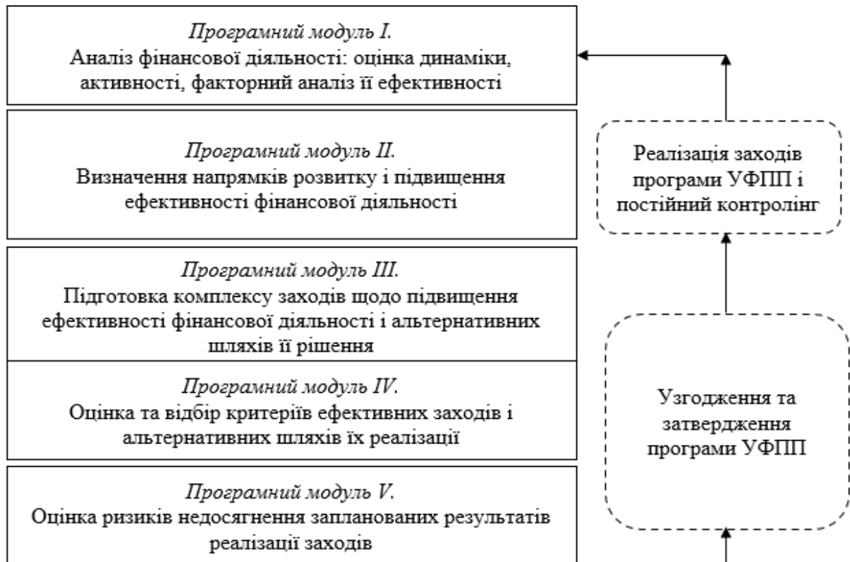
Рис. 3. Структурний зміст процесу формування механізму управління фінансовим потенціалом підприємства

Для побудови структури управління фінансовим потенціалом підприємства доцільно застосувати принцип матричної організаційної структури управління з виокремленням центрів фінансової відповідальності, на основі програмно-модульного та функціонального принципу управління.