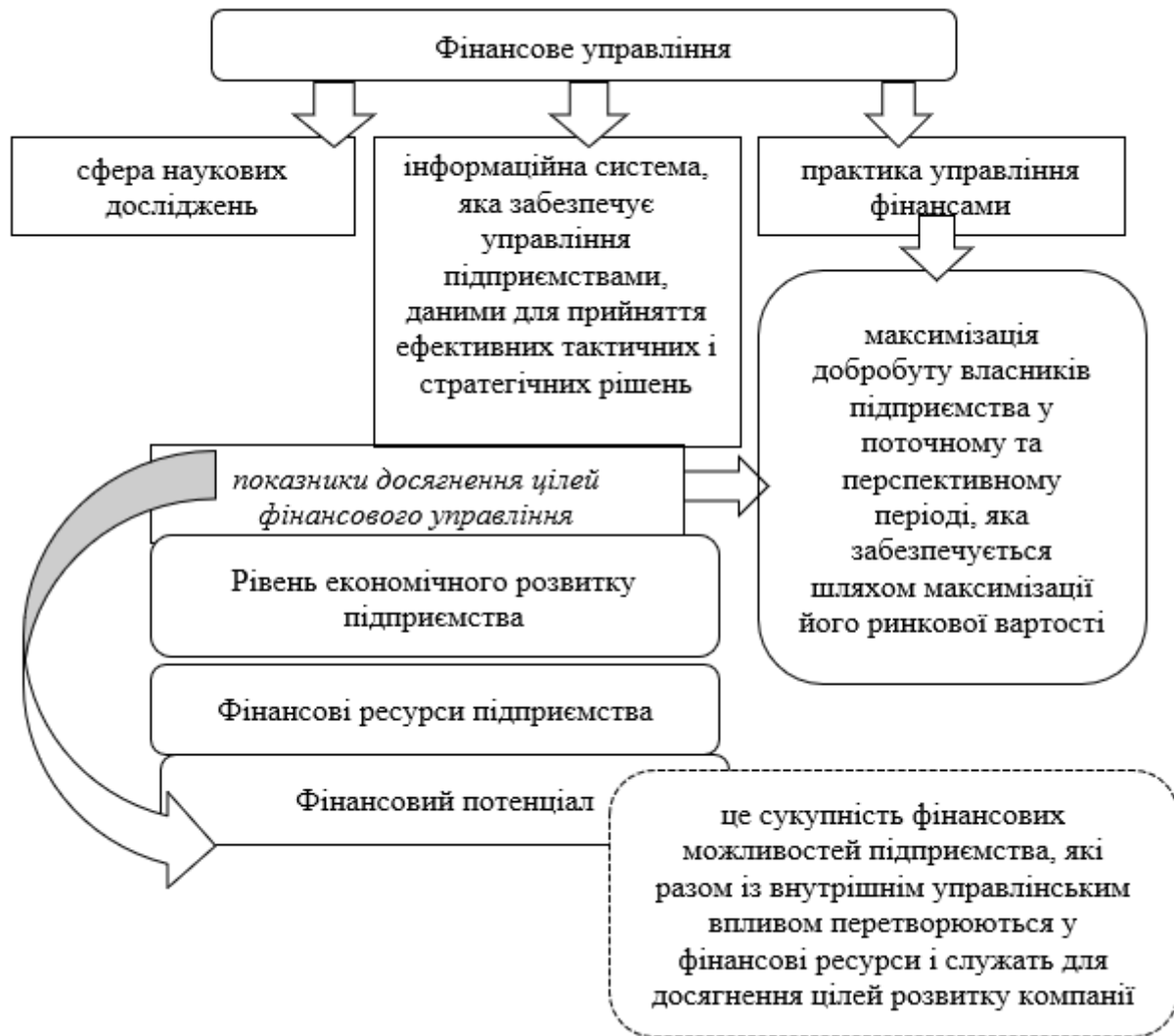
Рис. 1. Взаємозв'язок фінансового потенціалу і фінансового управління

Для підвищення ефективності управлінських заходів, направлених на підвищення ринкової вартості господарських суб'єктів, доцільним є структурування процесу управління фінансовим потенціалом.