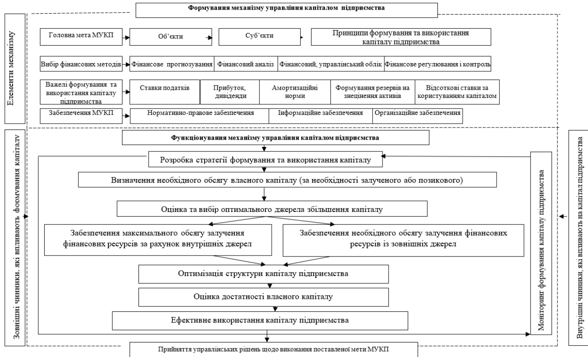
Рис. 2. Модель механізму управління капіталом підприємства

Розробивши структуру механізму та дослідивши основні елементи механізму управління формуванням та використанням капіталу підприємства розробимо його модель (рисунком 2).