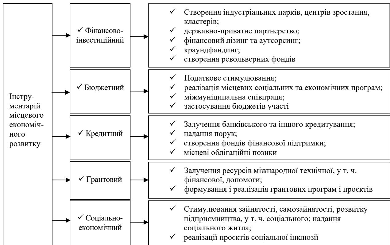
Рис. 1. Інструментарій політики розвитку територіальних громад

Не секрет, що на сьогодні, особливо в умовах війни, ресурс місцевого економічного розвитку дуже обмежений. Відтак, у значній мірі доводиться відшукувати альтернативні, часто не стандартні, інструменти досягнення місцевого економічного розвитку. Для кращого розуміння, які саме інструменти можуть бути залученими, важливо ідентифікувати їх повний спектр (рис. 1).