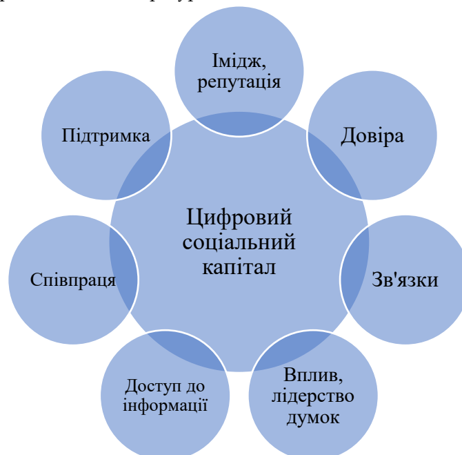
Рис. 2. Компоненти цифрового соціального капіталу.