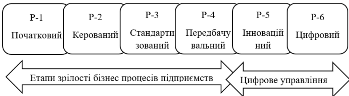
Рис. 2. Етапи зрілості бізнес процесів підприємств в умовах цифровізації економіки Створено автором.

Рівень Р4 – процес досягає досконалості, виходячи за межі компанії і враховує інтереси постачальників та клієнтів. (Лазебник Л., Войтенко В., 2021).