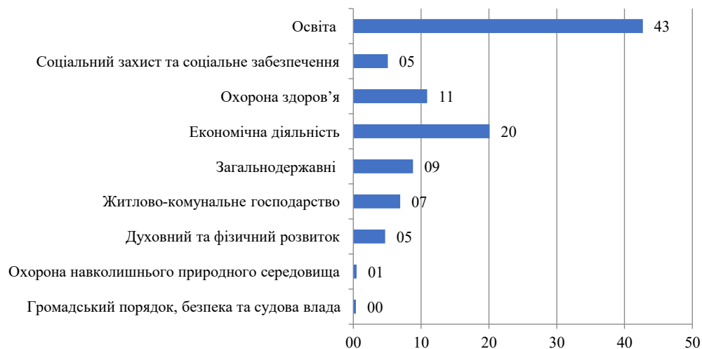
Рис. 1. Аналіз структури витратків місцевих бюджетів у 2020 р., %

Проте, офіційні дані свідчать про значні диспропорції витрат місцевих бюджетів у забезпеченні сталого розвитку територій. Так, у структурі видатків місцевих бюджетів найбільш потужним напрямом використання є освіта, частка витрат на яку у 2020 р. складала 42,7% (рис. 1). Причиною таких значних обсягів витрат є цільова освітня субвенція з державного бюджету, яка є однією із найбільш масштабних складових серед державних трансфертів. На економічну діяльність місцеві бюджети у 2020 р. спрямували 20,1% своїх видатків, що дає підстави зробити висновок про помітну підтримку економічного розвитку в регіонах з використанням власних бюджетних інструментів.